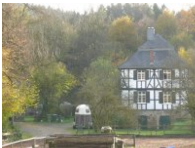
das Obersteigerhaus in Kaltenbach