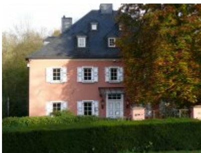
Burghaus in Unterkaltenbach

Drabenderhöhe steht mit Unterkaltenbach mit einem bekannten Kirchspielangehörigen in Verbindung.