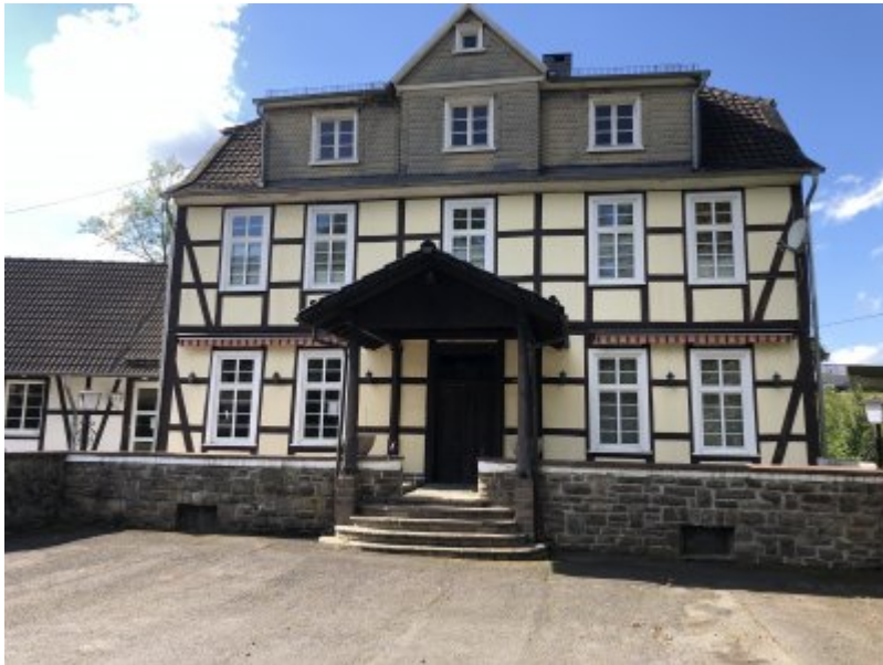
Kurhaus Kaltenbach im September 2023