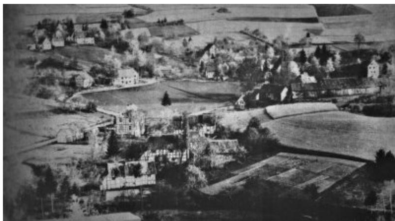
Oberkaltenbach um 1875